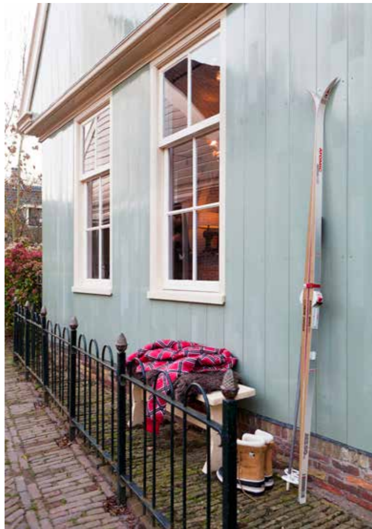
STYLING SABINE BURKUNK | FOTOGRAFIE HANS MOSSEL | TEKST FLOOR ROELVINK