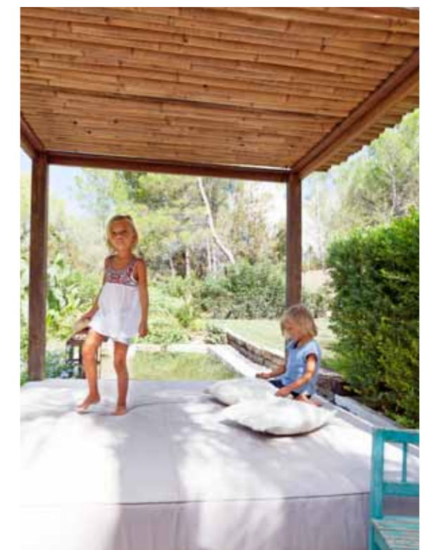
Alba en Victor kunnen lekker springen op het Balinese ligbed in de tuin.