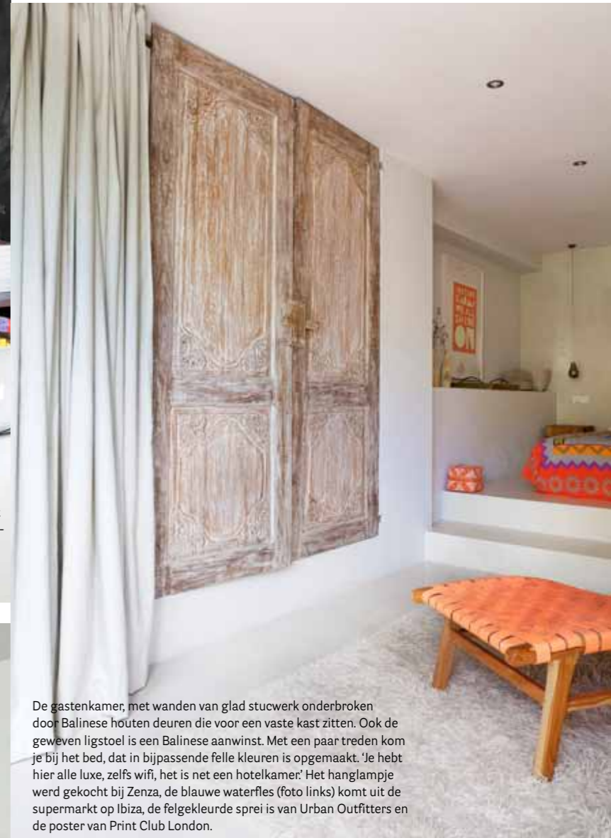
De gastenkamer, met wanden van glad stucwerk onderbroken door Balinese houten deuren die voor een vaste kast zitten. Ook de gewezen ligstoel is een Balinese aanwinst. Met een paar treden kom je bij het bed, dat in bijpassende felle kleuren is opgemaakt. 'Je hebt hier alle luxe, zelfs wifi, het is net een hotelkamer.' Het hanglampje werd gekocht bij Zenza, de blauwe waterfles (foto links) komt uit de supermarkt op Ibiza, de felgekleurde sprei is van Urban Outfitters en de poster van Print Club London.