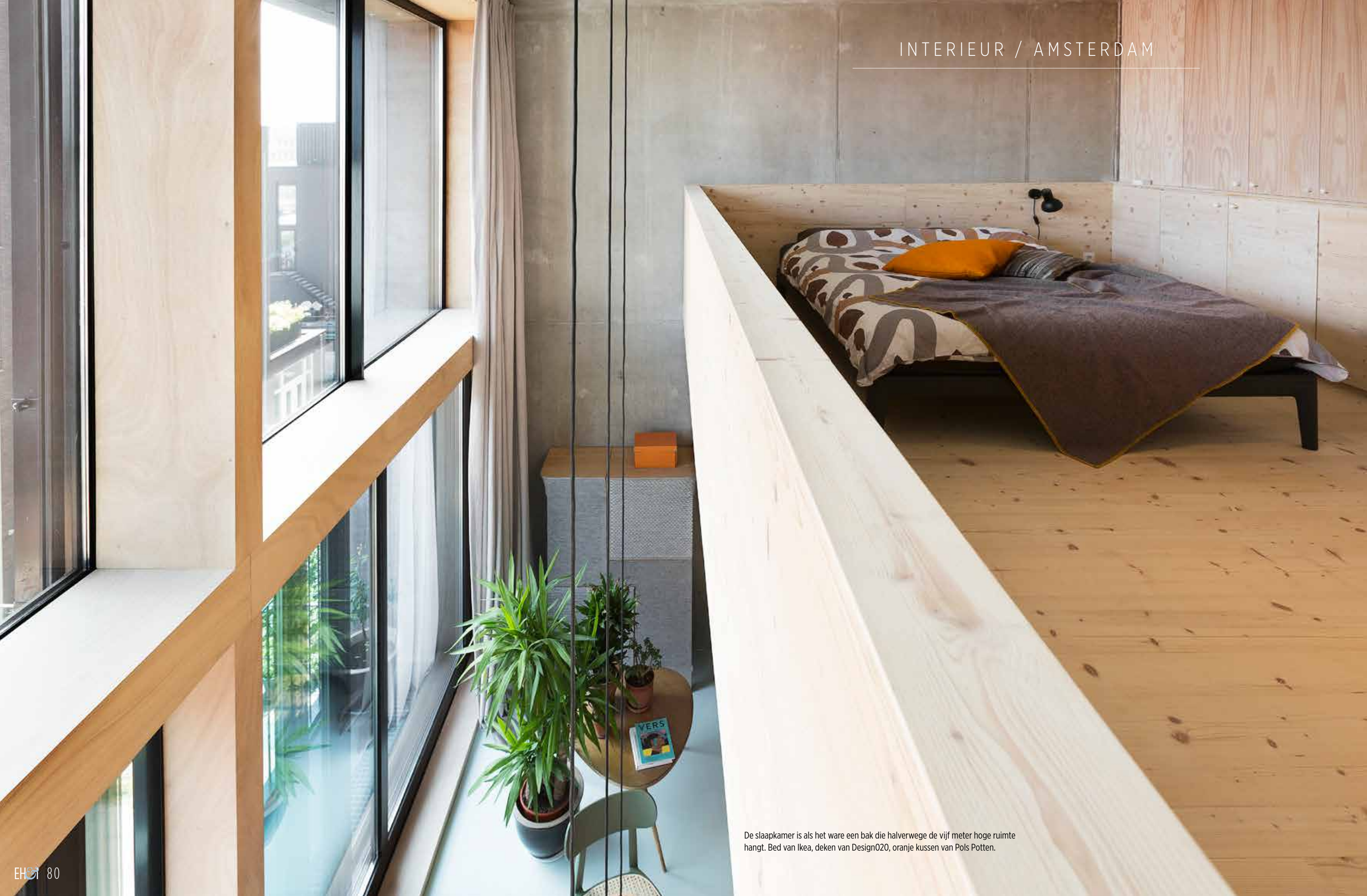
De slaapkamer is als het ware een bak die halverwege de vijf meter hoge ruimte hangt. Bed van Ikea, deken van Design020, oranje kussen van Pols Potten.