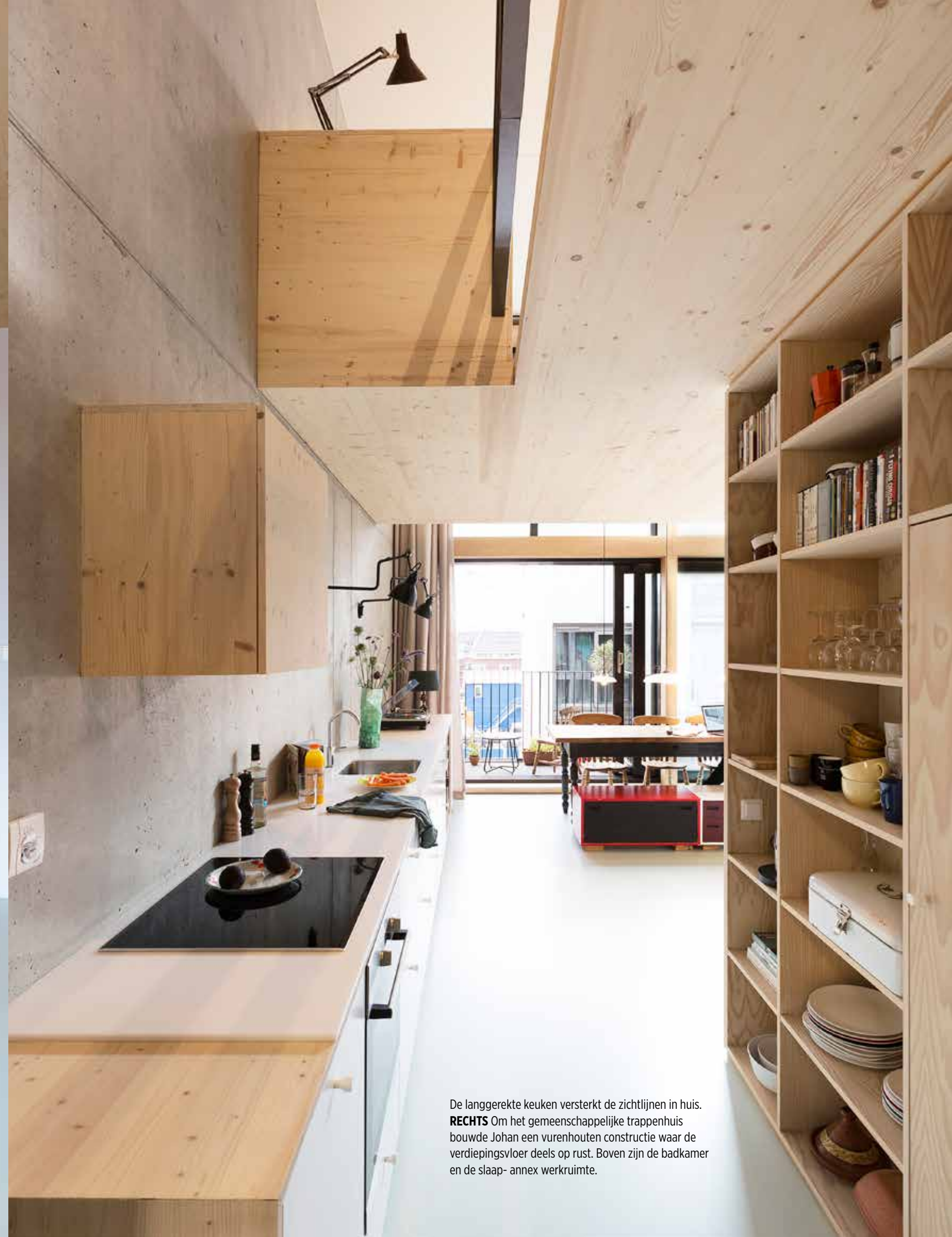
De langgerekte keuken versterkt de zichtlijnen in huis. RECHTS Om het gemeenschappelijke trappenhuis bouwde Johan een vurenhouten constructie waar de verdiepingsvloer deels op rust. Boven zijn de badkamer en de slaap- annex werkkruimte.