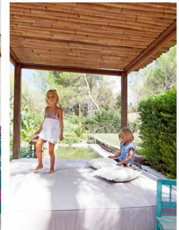
Alba en Victor kunnen lekker springen op het Balinese ligbed in de tuin.