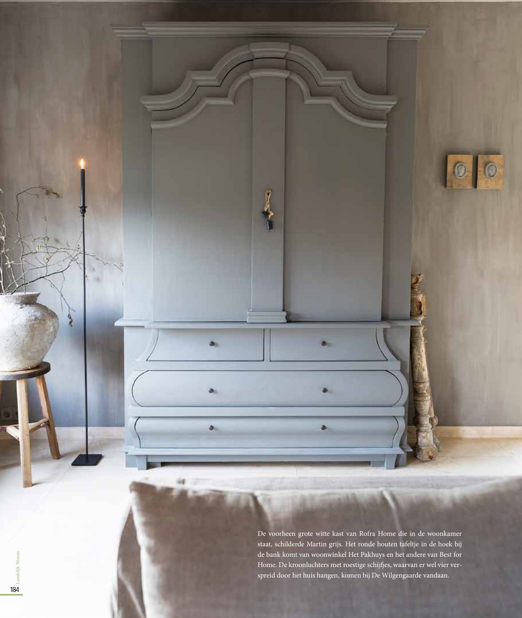
De voorheen grote witte kast van Rofra Home die in de woonkamer staat, schilderde Martin grijs. Het ronde houten tafeltje in de hoek bij de bank komt van woonwinkel Het Pakhuys en het andere van Best for Home. De kroonluchters met roestige schijfjes, waarvan er wel vier verspreid door het huis hangen, komen bij De Wilgengarde vandaan.